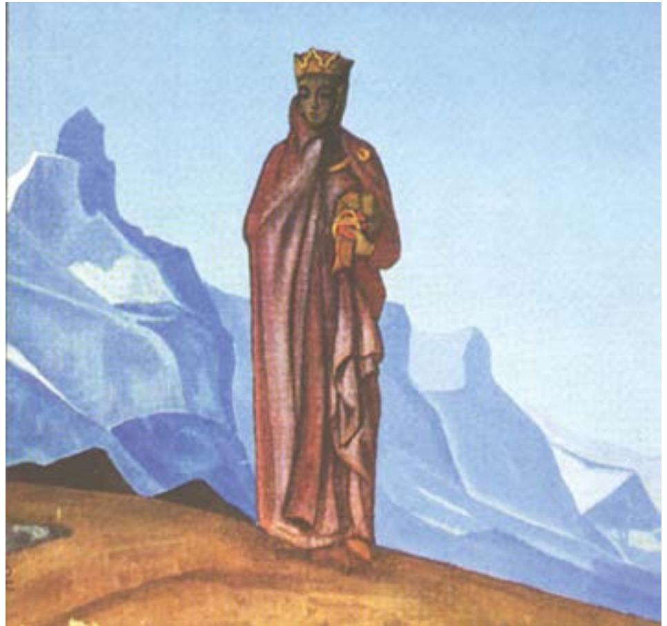
Ella que sostiene el mundo , por Nicholas Roerich, 1937

Aquí vemos la referencia directa al siglo