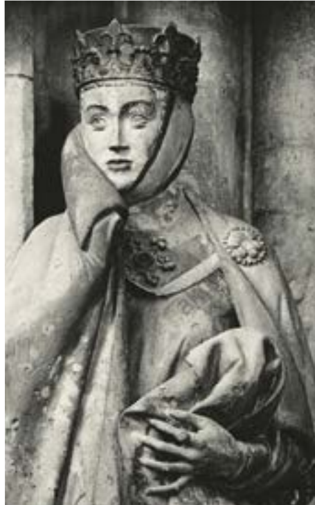
Estatua de Uta von Ballenstedt (primer plano)

Entonces, para resumir, basándonos en documentación histórica limitada que respalda los hechos, asumimos que el Duque de Tirol, el antiguo enemigo de Urusvati, Konrad, sabía quién era Uta