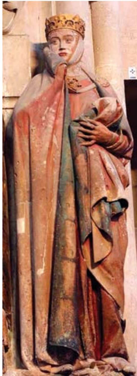
Statue of Uta von Ballenstedt

Entonces, ¿por qué N. Roerich eligió el prototipo de Uta para la obra de arte? ¿Cuál es la conexión de Uta von Ballenstedt con la familia Roerich, específicamente con Helena Roerich, y el misterio de la Piedra? Intentemos reunir alguna información