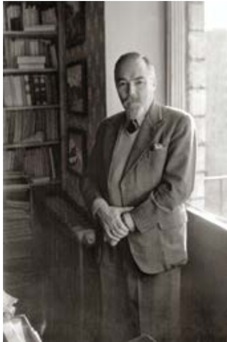
George Roerich, Moscú (1957–1960)

“Por tanto, el conocimiento es el camino ardiente. ¿No es inspirador saber qué tan cerca está el camino hacia el Mundo Ardiente?” ( Mundo Ardiente III , 497).