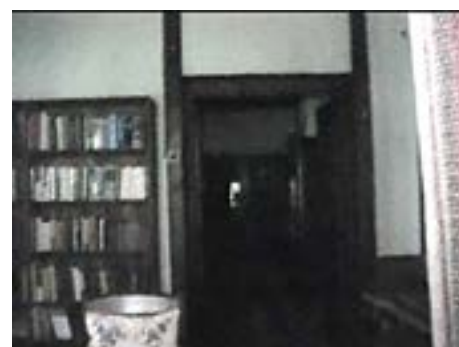
La casa de Roerich, biblioteca, Kulu Valley

Kanchenjunga, especialmente desde sus ventanas, nunca puede ser olvidada.