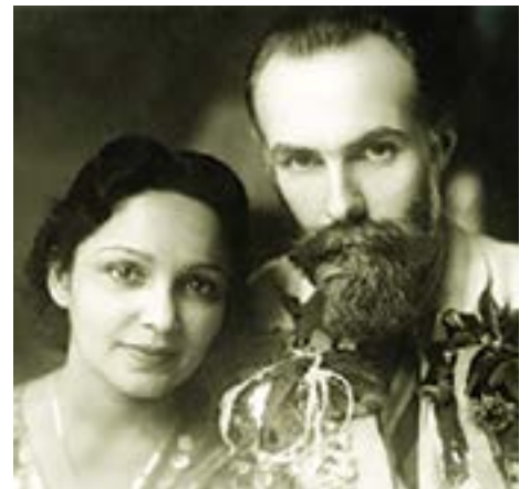
Svetoslav Roerich con su esposa, Devika Rani