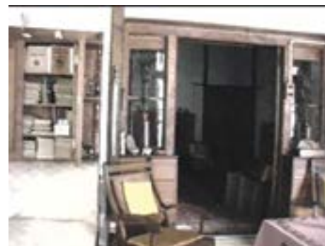
La casa de Roerich, interior, Kulu Valley

Todo el tiempo que estuve allí, trabajé en el manuscrito de Supramundano,