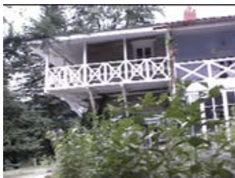
La casa de Roerich, Kulu Valley