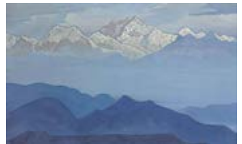
Esta pintura Roerich de Kachenjunga refleja la vista desde la casa Crookety