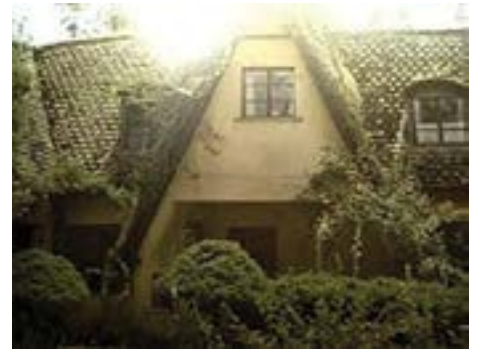
La casa Crookety, Kalimpong