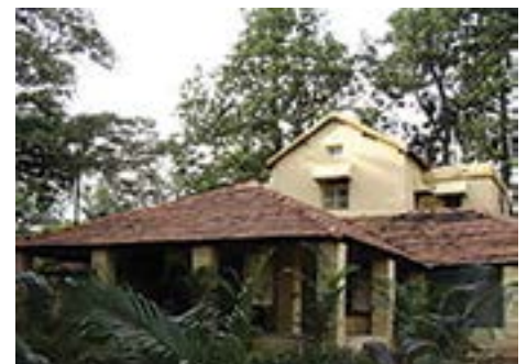
La casa de Svetoslav Roerich en Bangalore