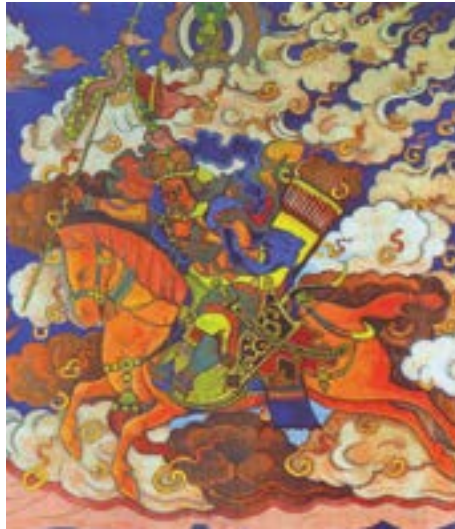
Gran jinete, Rigden Iyepo - Mensajera de Shambhala, 1927, por Nicholas Roerich

La Materia Matriz fundamental, que se encuentra en las capas superiores, se vuelve diferenciada. 3 La llamada Materia Lúcida es uno de los grados siguientes o inmediatos de su [diferenciación] disponible a la vista humana bajo ciertas condiciones. El llamado flogisto es Materia Lúcida . 4 Tal grado de Materia Lúcida puede ser visto en nuestro Sol en el momento de un eclipse completo como la corona del Sol, o fuerza electromagnética. Los Seres Superiores de nuestro planeta están