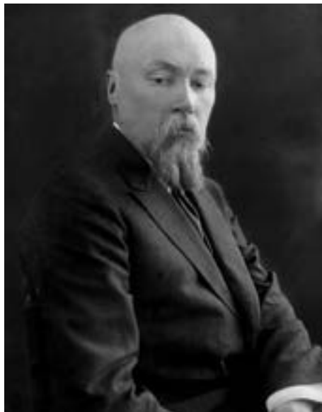
Nicholas Roerich, Paris, 1923

“Cuando una persona se sienta tranquilamente en una silla con los ojos cerrados, y su pensamiento no está ocupado con nada serio, entonces su materia cerebral produce descargas eléctricas regulares a razón de unas diez descargas por segundo. Con la ayuda de un aparato muy complicado e ingenioso y de una cámara fotoeléctrica, el profesor Adrian consiguió registrar estas descargas en una película de cine. Asimismo, observó que en cuanto su paciente abre los ojos y empieza a concentrar su atención en algo, la frecuencia de las descargas eléctricas aumenta considerablemente y alcanza por lo general unas dos mil por segundo.”