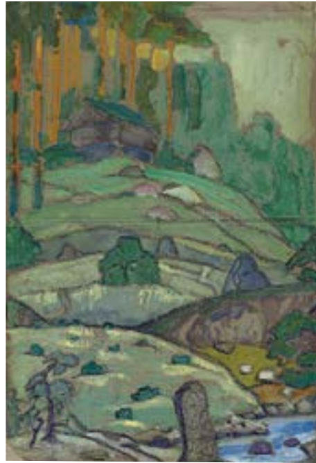
Hills , 1912, by Nicholas Roerich

Había "tres etapas de la [T]ercera Raza. La primera, la forma sexual; la segunda, hermafrodita; el hermafrodita se divide en dos sexos, se produce la separación. Los hombres divinos de Venus descienden cuando el tiempo está maduro para