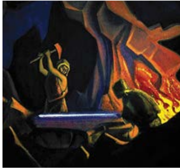
Forjando la espada (Nibelung) , 1941, por Nicholas Roerich

Hay que tener en cuenta que la saturación del espacio es muy alta cuando el Sol entra