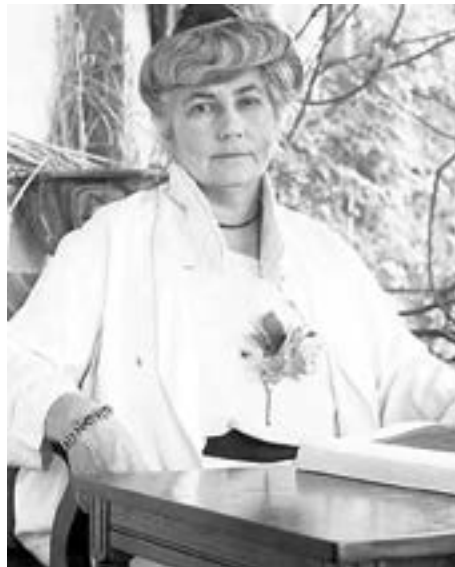
Helena Roerich, Naggar, India, 1930s

La ciencia podría dedicarse al estudio del rayo solar, o más concretamente, de su composición. Esta nueva y notable ciencia permitiría predecir el clima con un mes de antelación o para cada luna nueva. Así, el rayo solar no sólo controla el clima, sino que también sirve de indicador de las contracciones del núcleo planetario. Las contracciones van acompañadas de convulsiones de la corteza, terremotos e inundaciones, que pueden llegar a ser terriblemente destructivas e incluso modificar la inclinación del eje de la Tierra si las grietas en la corteza oceánica terrestre resultan ser muy profundas.