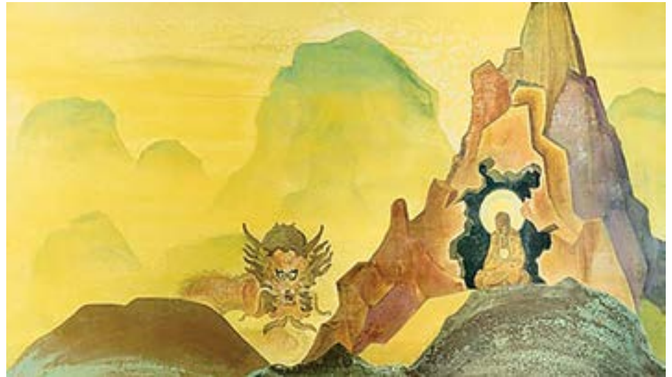
Arhat, 1932, por Nicholas Roerich

Toda nuestra vida como un alma, desde el momento de la encarnación hasta el momento de la muerte, desde el principio hasta el final, es una escalera de pruebas. Cada prueba es un momento de autoenfrentamiento. Es en ese momento que despertaremos y nos cambiaremos o huiremos y nos esconderemos, perdiendo una oportunidad para que nuestra alma avance, dando un nuevo paso hacia la libertad. Helena Roerich, la fundadora del Agni Yoga hace más de cien años, explicó a sus alumnos que sólo mien-