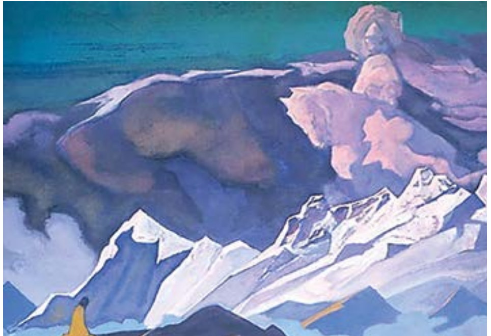
Kalki Avatar, 1932, de Nicholas Roerich

H.R. pregunta a M.M. "Mi Señor, me siento más fuerte de nuevo. ¿Es posible aumentar el fuego? ¿Quizás pueda comenzar con el pranayama?" M.M. responde: "No, Nuestras Torres