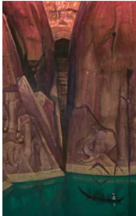
Ashram, 1933, de Nicholas Roerich

“Antes de visitar la Hermandad, después de haber pasado por la formación necesaria, a Helena Roerich se le mostró Su museo, una colección única de exhibiciones que ilustran la evolución cósmica de nuestro planeta. También