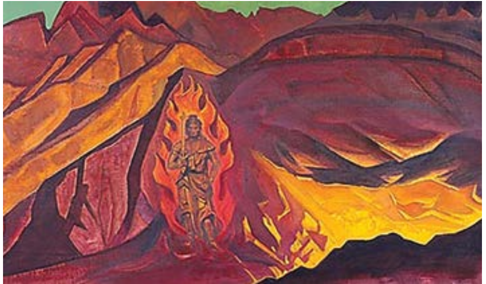
Guardián de la entrada , de Nicholas Roerich, 1927

El Maestro Morya tomó a Helena y la condujo a través de las montañas. Ella vio todo en el camino y recuerda la luz de la Torre. Por la noche tiene una luz azul eléctrica que sólo los clarividentes pueden ver. Esto mantiene a las fuerzas oscuras a una distancia de trescientas millas. Se llama el Ojo del Vigilante . Hay estatuas de grandes héroes a lo largo del camino. Si te conviertes en un gran héroe, se nos dice que tu estatua estará allí. Hay grandes tesoros, obras maestras recopiladas de cada artista, cada libro. Los Maestros cantan juntos y Ellos son perfectos músicos, cantantes, etc.