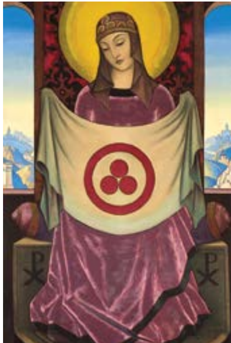
Madonna Oriflamma por N. Roerich, 1932

Incluso el silencio puede ser más fuerte que el trueno, tan bellamente relata el Antiguo Testamento. Pero, ¿cómo podemos prohibir que el corazón humano palpite por aquello que, para él, es esencial y querido? ¿Cómo podemos cesar todas las canciones, tanto terrenales como celestiales?