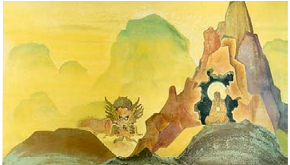
Arhat por Nicholas Roerich, 1932

“Unos pocos desean entender que el más elevado logro no está en el psiquismo, tampoco en las visiones astrales, sino en la síntesis, en el desarrollo de las habilidades propias. Esta síntesis es alcanzada por el cumplimiento escrupuloso de nuestros deberes, o como dirían en el oriente,