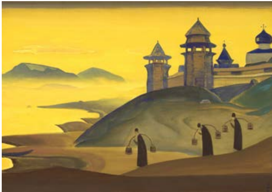
Y nosotros trabajamos por Nicholas Roerich, 1922.

“Aquel que dijo, “Nosotros vemos con los ojos del corazón,” no quiso expresar un símbolo sino una ley física. Una conciencia que ha sido profundizada y liberada manifiesta una transformación de todas