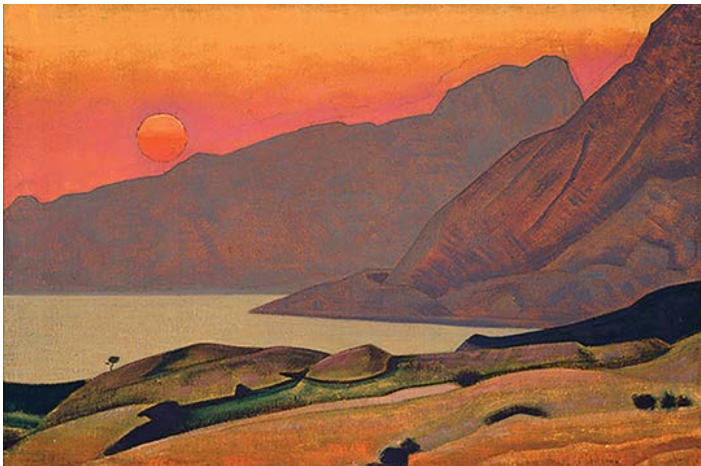
Monhegan, Maine (de la Serie Océano ), por Nicholas Roerich, 1922