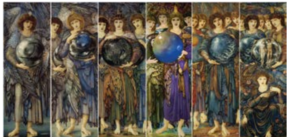
Os Dias da Criação, 1870–1876, de Edward Burne-Jones