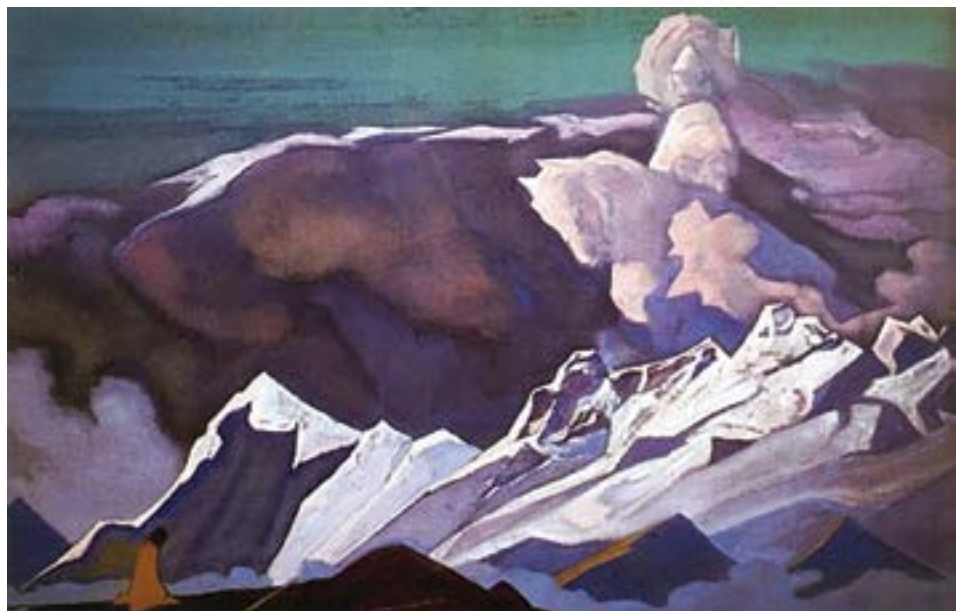
Kalki Avatar , 1935, de Nicholas Roerich

revela: “O microcosmo está fazendo o mesmo trabalho”. 1 A nível individual, os microcosmos dentro do sistema solar também passam pelos seus próprios processos de transformação. Enquanto o Logos evolui, os seres individuais avançam em seus caminhos evolutivos. As almas encarnam em diferentes formas e reinos, vivenciam várias vidas, acumulam conhecimento e crescem espiritualmente, “progredindo de um estado de relativa perfeição para outro”. Este processo de reencarnação e experiências sucessivas leva à transformação e evolução das almas individuais. Através da meditação, da auto-observação e do controle dos pensamentos, emoções, palavras e ações, constrói-se