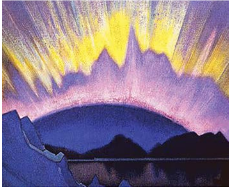
À meia-noite. Luz de Shambhala, 1940, de Nicholas Roerich

O Anima Mundi , como personificação cósmica da transformação e da síntese, serve como uma luz orientadora para inspirar o crescimento espiritual e evocar a unidade e a síntese tanto no macrocosmo como no microcosmo. Ao reconhecer a energia transformadora da Alma do Mundo, os indivíduos podem ser inspirados a purificar-se e a embarcar na jornada espiritual a serviço da humanidade. Dentro do macrocosmo, a Alma do Mundo serve para unificar e sintetizar, ligando todos os elementos do sistema solar, incluindo os planetas, as estrelas e as forças cósmicas num Uno harmonioso. Através do Anima Mundi , todos os corpos espaciais servem a um propósito