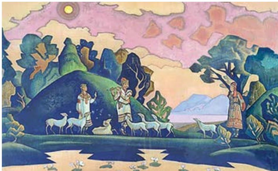
Krishna-Lel , 1932, de Nicholas Roerich

Considerando a grande importância do fator energia psíquica no tratamento de doenças, a medicina da Agni Yoga aconselha a utilização de plantas e outros produtos do reino da natureza como remédios curativos; estes contêm ingredientes de energia psíquica que contribuem direta ou indiretamente para isso. Assim, a Agni Yoga enfatiza o grande signifi-