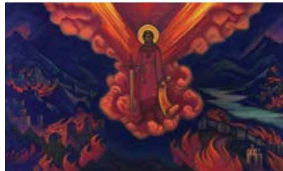
O Último Anjo, 1942, de Nicholas Roerich

d. Será o Anjo do Juízo Final (ver O Último Anjo de N.R.). Diz-se que Ele é responsável por ajudar a Terra e Sua qualidade peculiar é a Caridade.