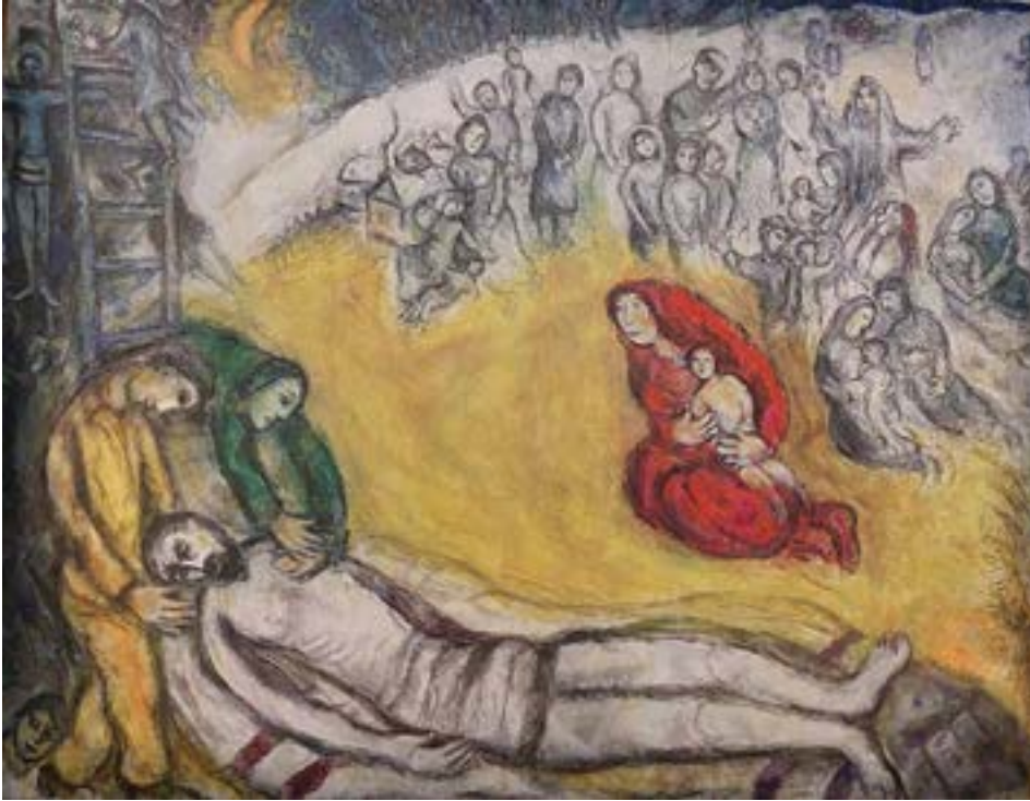
Maria Madalena , 1976, de Marc Chagall

Em julho de 2022, a Itália acolheu a primeira exposição de arte inteiramente dedicada a Maria Madalena “ Madalena: Mistério e Imagem ”, incluindo mais de duzentas pinturas e esculturas originais, desde o século XIV até aos dias de hoje. 9