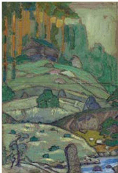
Hills , 1912, by Nicholas Roerich

Houve “três etapas da [T]erceira Raça. Primeiro, a forma sexual; segundo estágio da Terceira Raça e, por sua influência, a androginidade latente é acelerada em her-