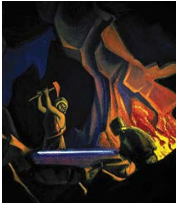
Forjando a Espada (Nibelung) , 1941, por Nicholas Roerich

Deve-se ter em mente que a saturação do espaço é muito elevada quando o Sol entra numa nova constelação e os seus raios ficam saturados com a nova química dessa