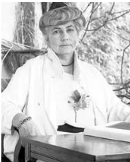
Helena Roerich, Naggar, India, 1930s

A ciência pode dedicar-se ao estudo do raio solar, ou mais especificamente, da sua composição. Uma ciência tão nova e notável permitiria prever o tempo com um mês inteiro de antecedência ou para cada lua nova. Assim, o raio solar não apenas controla o clima, mas também serve como um indicador de contrações no núcleo planetário. As contrações são acompanhadas por convulsões da crosta, terremotos e inundações, que podem tornar-se terrivelmente destrutivas e podem até alterar a inclinação do eixo da Terra se as fissuras na crosta oceânica da Terra se revelarem muito profundas.