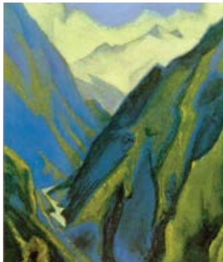
Ganges (Ravina Fria) , 1946, por Nicholas Roerich