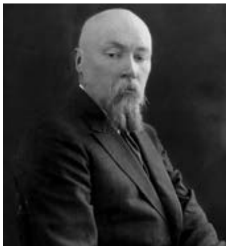
Nicholas Roerich, Paris, 1923

em 1932 o Prêmio Nobel e há poucos dias foi agraciado com a medalha de ouro da Royal Society.”