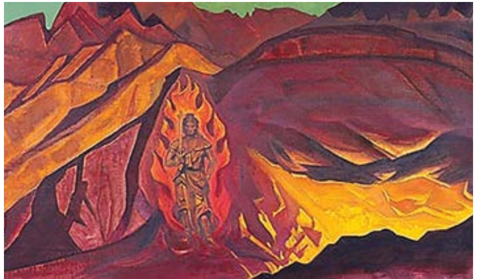
Guardião da Entrada , de Nicholas Roerich, 1927

Diz-se que eles têm coleções de objetos de arte e estudam a aura desses objetos. Ao estudar a aura de uma pintura de um grande artista, eles viram que a aura era muito bonita, mas que uma parte dela estava degenerada. Verificando os registros, eles descobriram que três pessoas que compraram e venderam a pintura