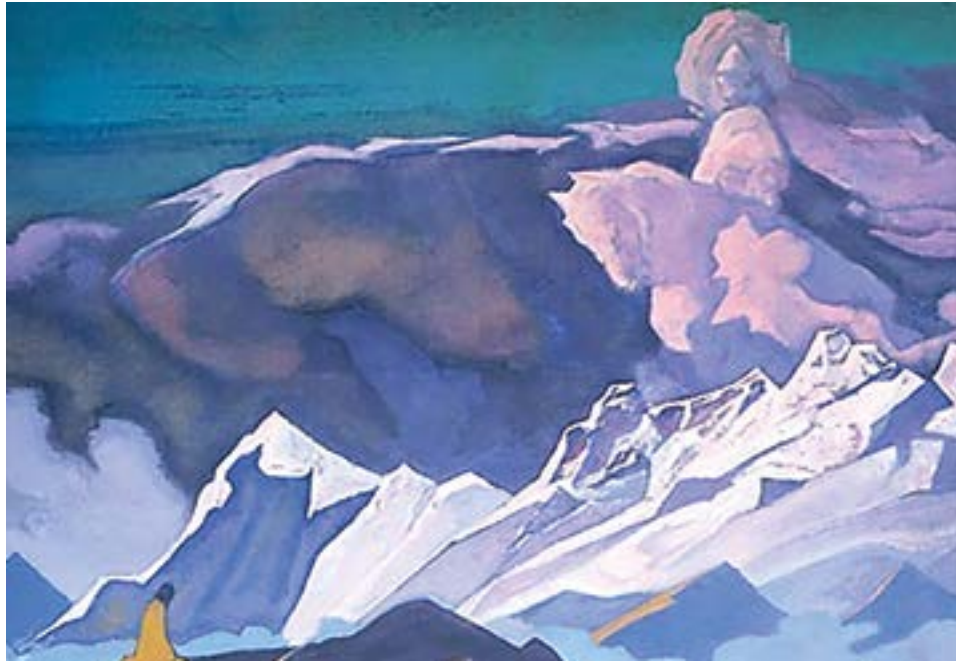
Kalki Avatar, 1932, de Nicholas Roerich