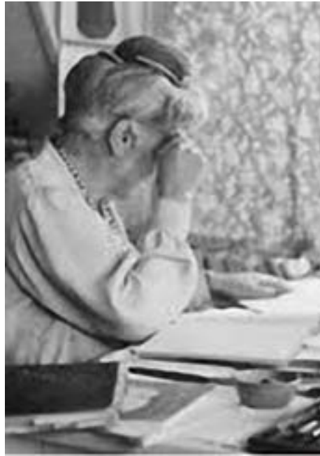
Helena Roerich em sua mesa

Minha carteira é inesgotável, mas “Ande com alegria. É uma alegria para Mim liderar os sorridentes. Discernir o Ensino da Luz em cada manifestação.” 21