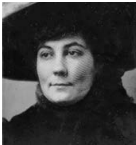
Helena Roerich, circa 1910

Pratique cada ação com leveza, amor e sabedoria. Tentem ser um escultor sábio em moldar a si mesmo e aos outros, cuidando para não ser como barro mole em mãos desafortunadas.