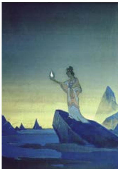
Agni Yoga, 1929, de Nicholas Roerich

A Lei da Hierarquia é a continuidade do mais baixo ao mais alto. Existem inúmeros elos do mais baixo ao mais alto, mas há apenas uma continuidade. Alguns se referem à Escada de Jacó para simbolizar esta imagem. Por exemplo, Helena Roerich diz: “E verdadeiramente falando, o que é a Hierarquia da Luz senão a ‘Escada de Jacob?’” 4