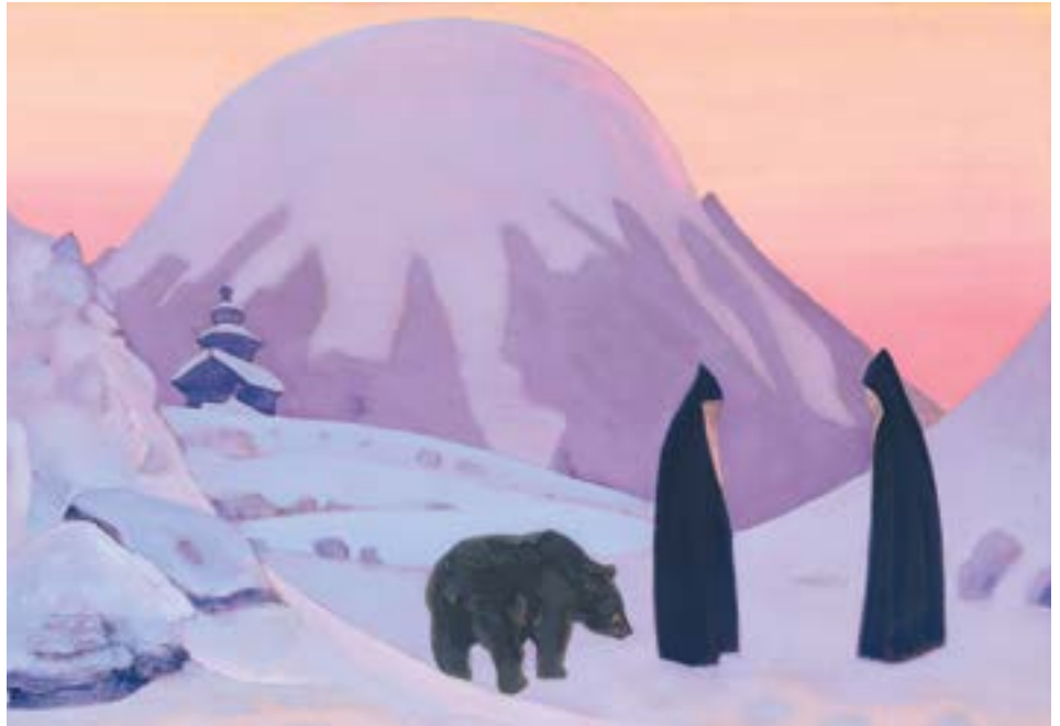
E não temos medo, 1922, de Nicholas Roerich

“Para aqueles que encontraram e para aqueles que responderam, eu digo: