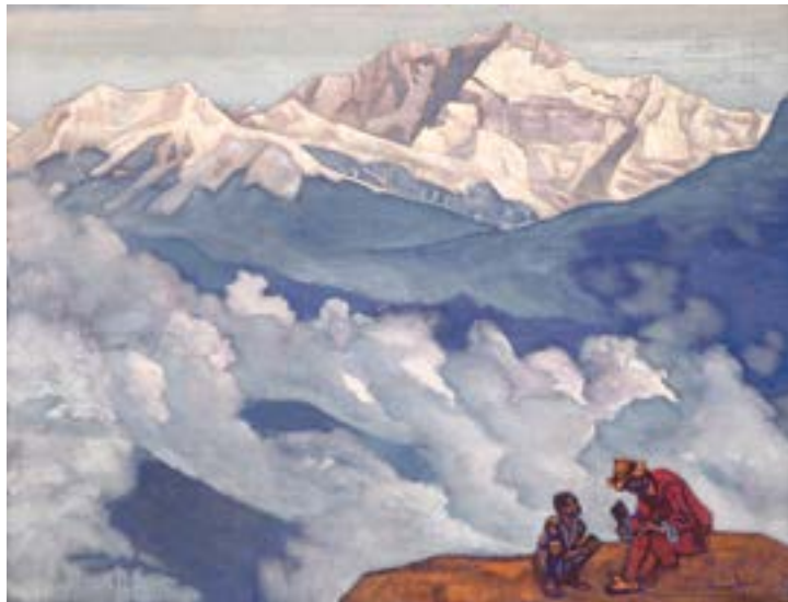
Perla della ricerca, 1924, di Nicholas Roerich

Shyam disse che mi avrebbe fatto cinque trattamenti. Se avessero funzionato, bene; in caso contrario, disse che avrei dovuto considerare la fusione spinale. Avevo visto molti casi di fusione spinale quando