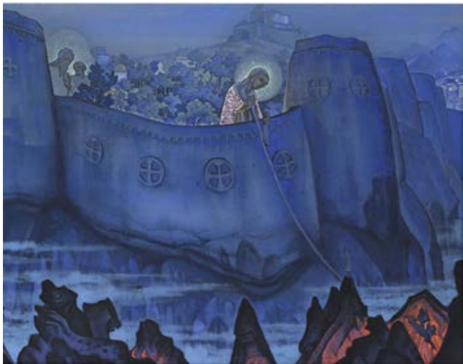
Madonna Laboris , 1931, di Nicholas Roerich

Così, anche alla donna viene affidato un compito cosmico, di cui deve essere ben consapevole. Vale a dire, trasmutare la natura inferiore e grossolana dell'uma-