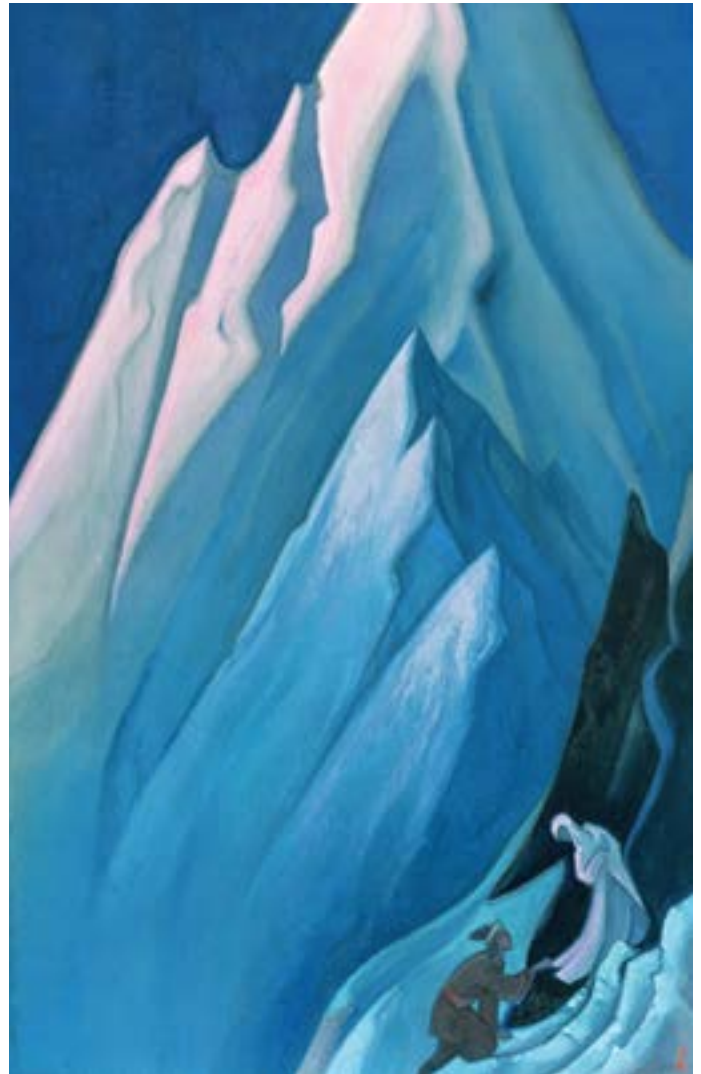
Colei che guida , 1944, di Nicholas Roerich

Gli anni '70 furono di pausa, qualcosa che auguro a tutti coloro che prendono sul serio la vita. Molti di noi risparmiano le domande fino al pensionamento o alla fine di un episodio della propria incarnazione. Io sono stato fortunato, ho avuto l'opportunità di entrare nel profondo e il tempo di purificare il mio cuore e la mia anima mentre osservavo un mondo che era total-