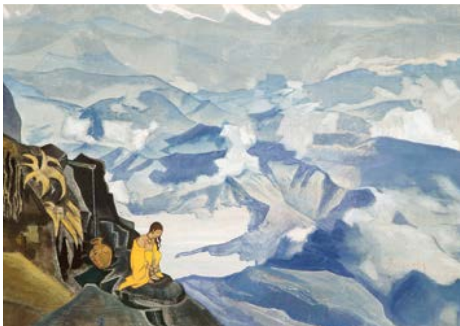
Gocce di vita , 1924, di Nicholas Roerich

È passato più di mezzo secolo dall'immersione in questa affascinante disciplina medica. Ho letteralmente letto centinaia di libri sull'Ayurveda, incontrato dozzine di medici ayurvedici, partecipato a innumerevoli seminari, ospitato oratori, sottoscritto parte della formazione dei medici ayurvedici, condiviso case-history, co-autore di presentazioni e pubblicazioni e testato clinicamente molte erbe e formule a base di erbe. Non sono un dottore. Mi sono laureato in studi asiatici da studente universitario, ma ero principalmente interessato all'antropologia e alla filosofia. Il mio pensiero in quel momento era che siamo qui oggi perché i nostri antenati hanno preso molte buone decisioni in passato,