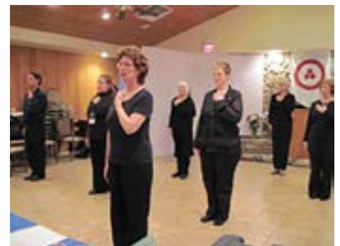
Danze Sacre alla Conferenza annuale di Etica Vivente a Prescott, Arizona

Yoga e sull'Insegnamento dell'Etica Vivente, permettimi di suggerire alcune cose. In primo luogo, ci sono due siti Web sponsorizzati dal Nicholas Roerich Museum e dall'Agni Yoga Society (New York City), che possono farti trascorrere molte, molte ore immersi negli studi dell'Agni Yoga, oltre a goderti i dipinti e gli scritti magistrali di Nicholas e Helena Roerich: http://agniyoga.org/ay_en/search.php and http://www.roerich.org/