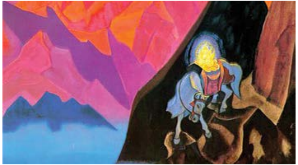
Tesoro del Mondo (Chintamani) di Nicholas Roerich, 1924

“Per molti secoli lo spirito della Blavatsky accumulò conoscenza. Ecco perché fu poi in grado di scrivere La Dottrina Segreta e portare nel mondo la conferma dell’esistenza della Grande Fratellanza e della perdita della suo sapere. Non si dovrebbero mai fare paragoni; chi sarebbe in grado di comprendere o conoscere la differenza