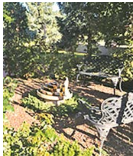
Izvara Center, Giardino di meditazione

Teachers - Meetings with the Roerichs. Nonché gli opuscoli di alcuni Insegnamenti di Etica Vivente, tra i quali Death and Transition , Obsession and Possession , e Ailments and Remedies . Tutti opuscoli sono tutti indicizzati. Inoltre, sulla pagina Facebook, sponsorizzata da WMEA, https://www.facebook.com/groups/Agni.Yoga.Living.Ethics.Community/ . E, naturalmente, c'è la nostra pubblicazione Agni Yoga Quarterly , e gli archivi sono disponibili a questo link: https://wmea-world.org/wmea/agni-yoga/ .