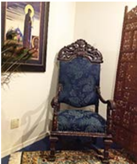
Izvara Center, il Trono Sacro

Ottobre per la White Mountain Education Association è il mese delle celebrazioni! Ottobre 2019 ci conduce alla celebrazione annuale della fondazione di questa bellissima comunità. Quest'anno il WMEA celebrerà il trentasettesimo anno della sua fondazione. Nel 1982, siamo stati legalmente istituiti come organizzazione educativa /