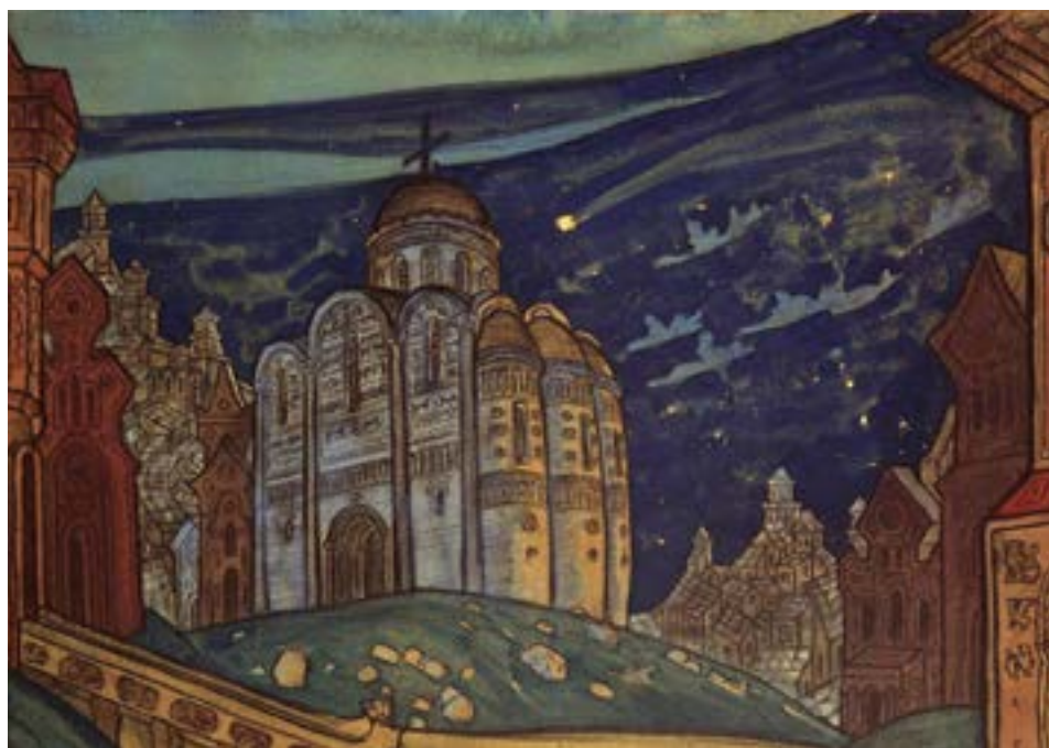
Putivl Eclipse di Nicholas Roerich, 1914

I raggi X reagiscono ai raggi del Sole. Con l'emanazione di questi raggi, alla tua partenza dall'India, il nuovo Sole rivelerà un cerchio. Questo cerchio apparirà per tre giorni come un riflesso del Sole lontano. Un tale passaggio provocherà una forte perturbazione dell'intero sistema. Al momento della tua partenza la cometa ardente apparirà nuovamente nel 195[...]. I raggi del Nuovo Pianeta infiammeranno tutte le mucose. I raggi del Sole nasconderanno la visibilità del Nuovo Pianeta, allo stesso modo la cometa che, avvicinandosi troppo al Sole, nasconderà la sua visibilità ai raggi del Sole. Il nucleo del pianeta conterrà nuovi metalli molto forti che provocheranno esplosioni nell'atmosfera che lo circonda. Il pianeta ardente si svelerà