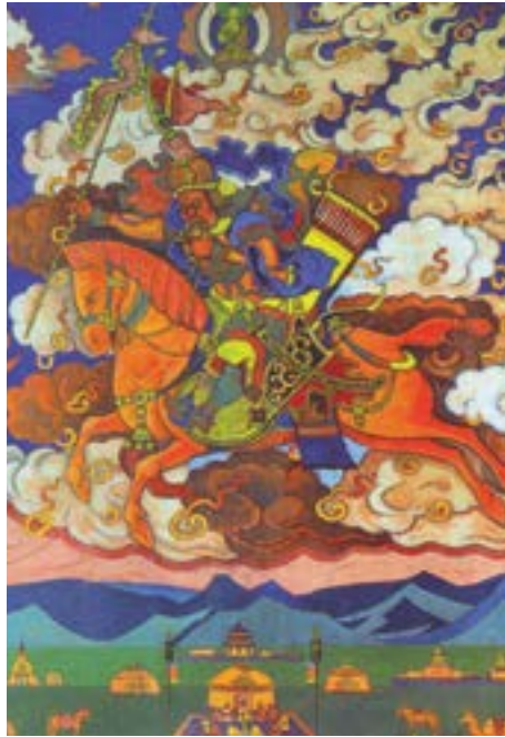
Il Grande Cavaliere, Rigden Jyepo – Messaggero di Shambhala, 1927, di Nicholas Roerich

L'ossigeno è una delle infinite differenziazioni manifestate delle sostanze del fuoco