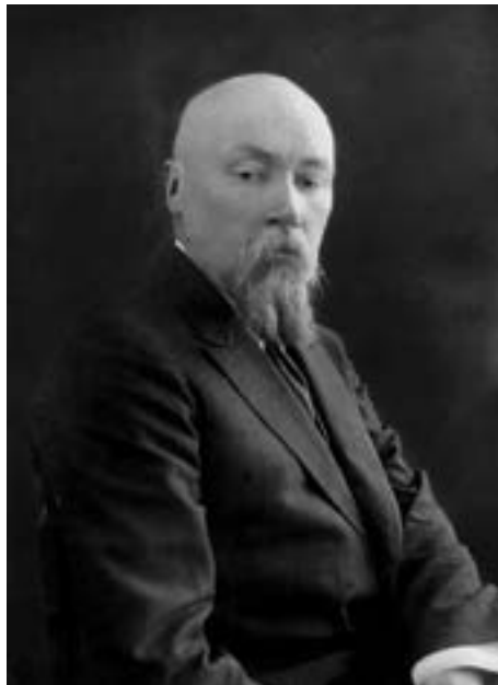
Nicholas Roerich, Paris, 1923

"Quando una persona siede tranquillamente su una sedia con gli occhi chiusi e il suo pensiero non è occupato da nulla di serio, la sua materia cerebrale produce scariche elettriche regolari al ritmo di circa dieci scariche al secondo. Con l'aiuto di un apparato molto complicato ed ingegnoso e di una telecamera fotoelettrica, il Prof. Adrian riuscì a registrare queste scariche su una pellicola cinematografica. Allo stesso modo osservò che non appena il suo paziente apre gli occhi e comincia a concentrare la sua attenzione su qualcosa, la frequenza delle scariche elettriche aumenta considerevolmente e raggiunge solitamente circa duemila al secondo."