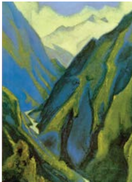
Ganges (Burrone Freddo) , 1946, di Nicholas Roerich

progenitori," 6 (i Signori della Luna), "chiamati anche 'auto-nati' – erano, nel nostro senso, muti, poiché erano privi di mente sul nostro piano." 7 "La moltiplicazione di questi esseri avveniva per fissione o per gemmazione. . . . Crescevano, espandendosi in dimensioni, e poi si dividevano, dapprima in due metà uguali, e poi nelle fasi successive in porzioni disuguali che germogliavano da una progenie più piccola di loro, che cresceva a sua volta e di nuovo germogliava dai loro piccoli." 8