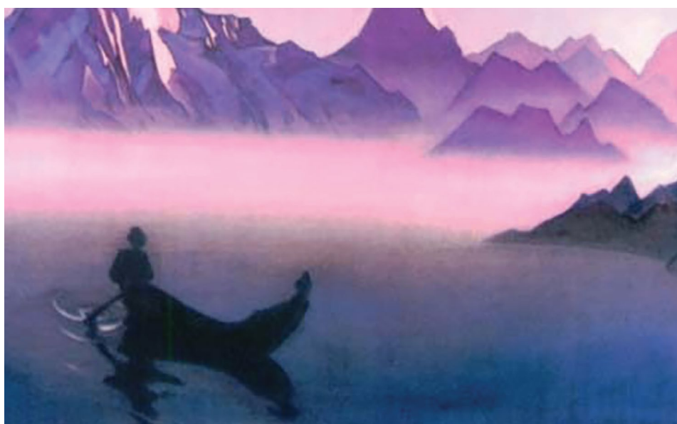
Nicholas Roerich, 1940 Messaggero dall'Himalaya: ritorno a casa

l'uso dei caratteri cinesi e di altri simboli possa servire da collegamento unificante tra diverse culture e religioni. I simboli e i suoni dei personaggi accendono un ritmo sincronizzato, consentendo a ogni viaggiatore di unirsi con l'Uno universale.