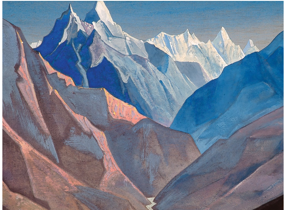
Nicholas Roerich, Mount "M," 1931

Sono stato attratto dallo studio più approfondito della lettera "M". "È sia femminile che maschile, o androgino, ed è fatto per simboleggiare l'Acqua, il grande abisso, nella sua origin." 6 L'immagine di una "M" ricorda un'onda e un movimento ritmico, evocando l'immagine del tempo, con le onde che ricordano il passaggio del tempo e i cicli della vita. Interessante è l'immagine del Loto, un altro simbolo antico che spesso si trova nell'acqua. Cresce dalle acque fangose che emergono al sole in pura bellezza. Il loto è un simbolo di illuminazione e crescita spirituale in molte religioni: induismo, bud-