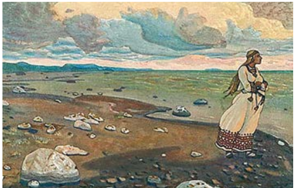
Beyond the Seas There Are the Great Lands, 1910, di Nicholas Roerich

re e trasmutare lo spirito all'istante. [. . .] In verità, le perle dell'arte esaltano l'umanità e i fuochi creativi dello spirito le rivelano una migliore comprensione della bellezza.” 1