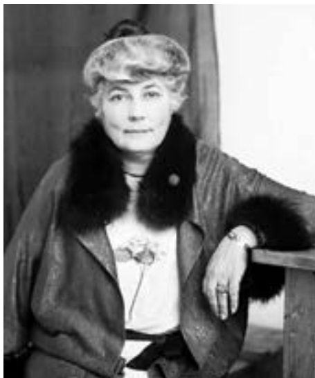
Helena Roerich, 1930 circa a Naggar, India

Intelligenza Cosmica: La Gerarchia della Luce . Intelligenze che hanno completato la loro evoluzione umana in questo o in un altro sistema solare, gli Spiriti Planetari, i Creatori dei Mondi. Questi Creatori sono i Maestri Costruttori degli universi presenti e futuri. Pertanto, il più alto Gerarca del nostro pianeta è una delle Gemme più risplendenti della Corona dell'Intelligenza Cosmica .