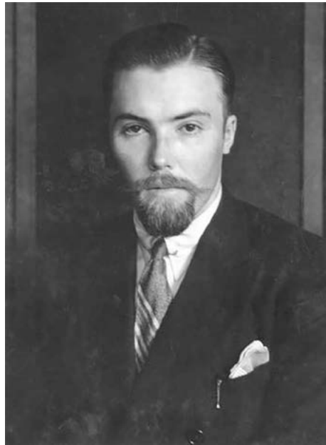
GEORGE ROERICH (Yuri Nikolayevich Roerich) 1902–1960

“Nuestros amados Maestros y Líderes, Nicolás y Helena Roerich, fueron los instrumentos escogidos para llevar esta Enseñanza a la humanidad en este período, él a través de su gran arte, su síntesis alcanzada en numerosas vidas; ella a través de los logros supremos aquí en la Tierra como la Madre del Agni Yoga. La mezcla de estos dos grandes espíritus en esta vida es en sí misma una suprema unión kármica. En sus muchos libros y escritos, Reino de la Luz , Shambhala , El Corazón de Asia , La Fortaleza Ardiente , Himavat , etc., por el Prof. Roerich; en Fundamentos del Budismo , Criptogramas de Oriente y Cartas de Helena Roerich, aprendemos más sobre estos dos Enviados de la Hermandad Blanca en esta Era. Y al estudiar el Agni Yoga, comenzamos nuestro ascenso hacia los Mundos Superiores. En verdad, es la Escala de Jacob, que empieza en la Tierra y llega a las estrellas, a los lejanos mundos que nos llaman. El hombre puede y debe ser el compañero de trabajo de las Fuerzas Celestiales.”