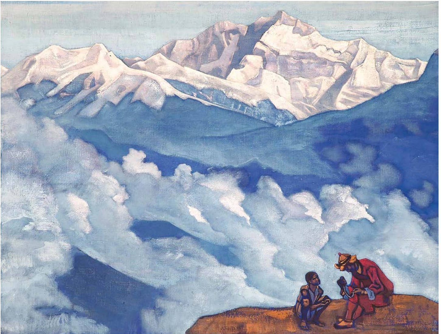
Perla de la Búsqueda , Nicholas Roerich, 1924

cieron a un pequeño grupo de fervientes buscadores espirituales y seguidores de su gran arte. Con ellos, el Prof. Roerich fundó una escuela de artes, llamada Master School of United Arts (Escuela Maestra de Artes Unidas). Posteriormente se fundó el Museo Roerich, la Sociedad de Agni Yoga, el Centro Internacional de Arte, y más tarde el Pacto de Roerich y el Comité de la Bandera de la Paz. Así fue la piedra angular de una apreciación más profunda y mayor de la cultura puesta en el alma de América. Este fue uno de los esfuerzos de su gran Misión.