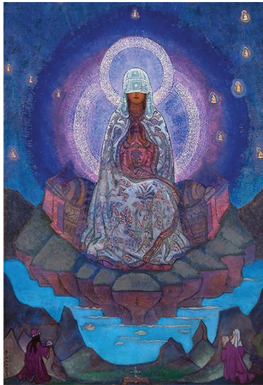
Madre del Mundo por Nicholas Roerich, 1924

Diré mi oración y la diré frente el sol.