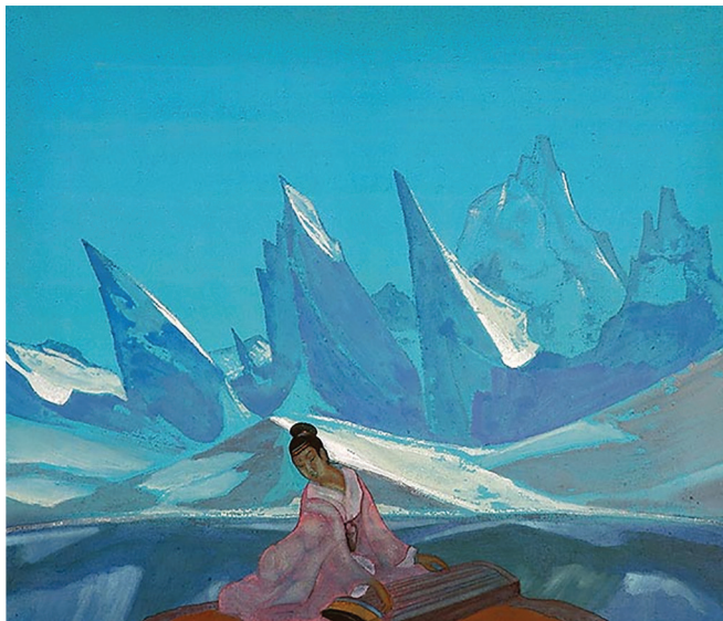
Kuan-Yin por Nicholas Roerich, 1933

La acumulación consciente en el Cáliz, en conjunto con la conciencia del Arhat, le permitirán a la vida formas psíquicas. ¡Sí, sí, sí!