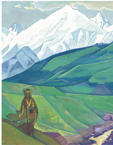
En-No-Gyoja, el Amigo de los viajeros, por Nicholas Roerich de 1924

festaciones de la Luz no son fáciles de lograr, pero luego el Fuego del Espacio ilumina los mundos distantes.