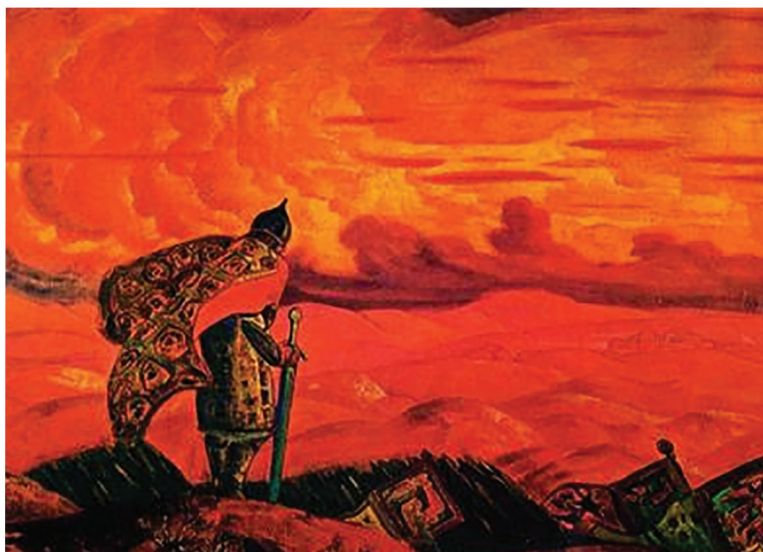
Flechas del Cielo, Lanzas de la Tierra , por Nicholas Roerich, 1915

Mundo Ardiente III , 471. Hubo un tiempo en que la Tierra se abría y se tragaba a los traidores. ¿Quién, entonces, puede imaginarse el destino diez veces peor de los traidores contem-