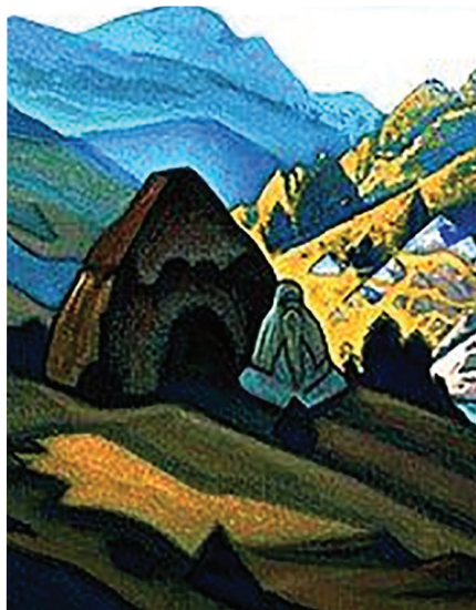
El Ermitaño por Nicolás Roerich, 1941

El Pensador dijo, “Mira, esas son las furias que has creado. Los dioses no están interesados en la venganza; es la misma