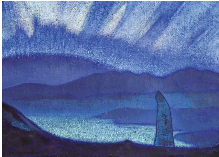
Puente de la Gloria por Nicolás Roerich, 1923

herramientas que dan forma a nuestros cuerpos inferiores. Ellas se presentan de muchas maneras: la meditación, estudio, servicio, esfuerzo, la revisión de todas las noches, la observación de sí, y colocarnos frente a nosotros mismos con honestidad. La disciplina es la única manera en que podemos cambiar. Nadie puede hacerlo por nosotros. Nuestros