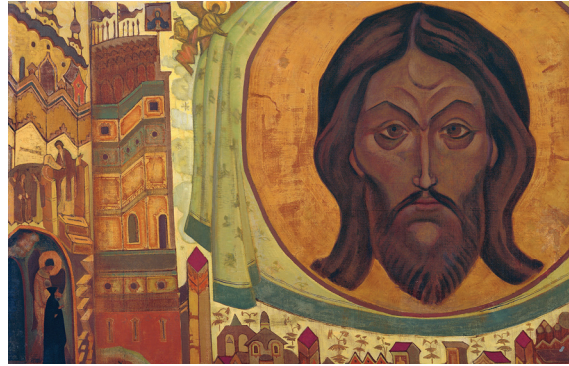
Y Vemos por Nicolás Roerich, 1922

La Llamada , 281. La Mano Que Guía planea sobre vuestro espíritu, Y como un