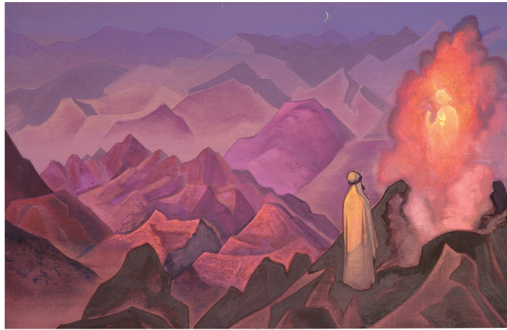
Mahoma el Profeta por Nicolás Roerich, 1925

el Guardián de la Verdad, es Aquél que dirige nuestros pasos hacia el Espacio Cósmico. El hombre puede pensar en los Guardianes. Por tanto, un espíritu que esté cerca de Nosotros puede sentir a los Guardianes en el Espacio Cósmico. En consecuencia, la creatividad del espíritu nos acerca a los Guardianes. Por