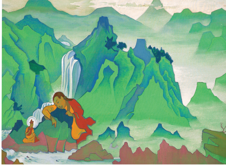
Padma Sambhava por Nicolás Roerich, 1924

sentir en el corazón la tibieza que surge desde las profundidades del espíritu. Es especialmente necesario sentir y aprender a discernir aquello por medio del cual la naturaleza del Señor está conectada con la del discípulo. Así, uno debe recordar