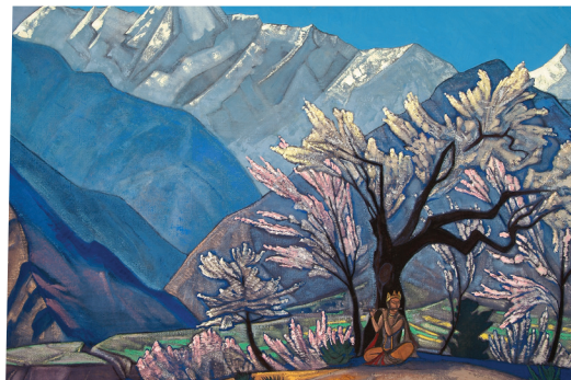
Krishna por Nicolás Roerich, 1929

dejaron testimonio de su vitalidad. Podemos ver cómo la gente puede cultivar sus habilidades hasta la perfección. Ellos sabían cómo escudarse entre sí y como cuidar la dignidad de la comunidad. Hasta que la gente no aprenda a defender el mérito de sus compañeros de trabajo ellos no alcanzarán la felicidad del Bien Común. (Verso 12)