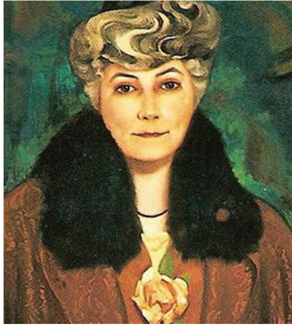
Helena Roerich por Svetoslav Roerich, 1937

De aquí que cada uno de los centros de Ur sea tan sensible a las catástrofes. De aquí que el corazón absorbe todas las energías como en un embudo espacial, sintiendo cada vibración. En consecuencia, el corazón resplandeciente como el Sol, ayuda en la purificación del espacio. El corazón impetuoso corre a encontrarse a mitad de camino con cada energía ardiente. Tal impetuosidad es posible solamente a través de la ardiente actividad propia, la cual se obtiene en el escalón supremo de la transmutación ardiente. Consecuentemente, cada vibración cósmica se siente tan agudamente. Cuando Nosotros indicamos terremotos, no siempre deberíamos esperar manifestaciones externas. Primero que todo, debemos mantener en mente a esos temblores que ocurren en las profundidades. Por