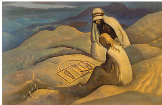
Los Signos de Cristo por Nicolás Roerich, 1924

Partimos en la noche en un camello blanco. Y viajando en las noches Llegamos a Lahore donde encontramos a un se-