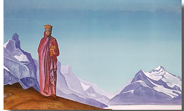
She Who Holds the World by Nicholas Roerich

Las pruebas en el sendero te revelan quien eres, lo que tienes y lo que necesitas superar. Por ejemplo, había un cirujano cardiólogo que se estaba divorciando de