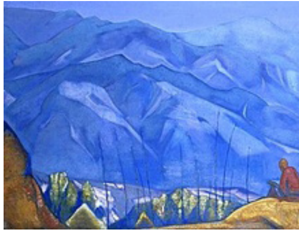
The Book of Wisdom by Nicholas Roerich

Por ejemplo, hay una hermosa historia de un anciano que, carente de toda escolaridad, vivía en la cueva de una montaña remota. Un estudiante escalaba la montaña