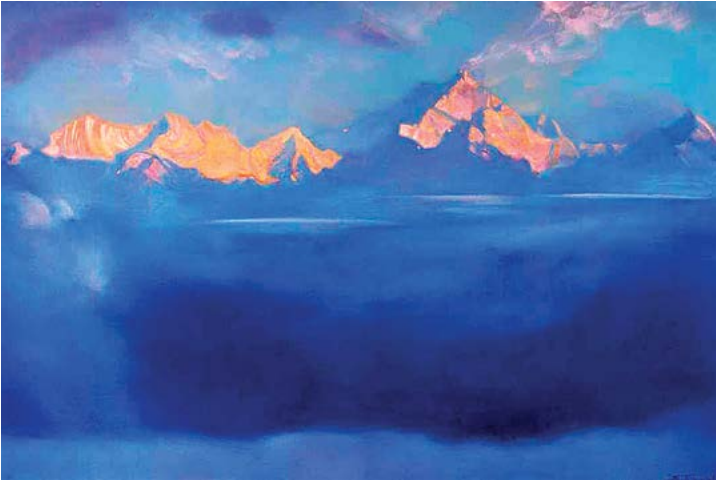
Katchenjunga da manhã por Svetoslav Roerich, 1952

precisa desenvolver seus músculos. Você está sentado em sua cadeira e está à espera deles desenvolverem por conta própria. Somente exercendo-os, superando as dificuldades, os músculos são desenvolvidos!