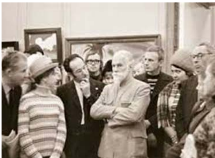
Svetoslav Roerich rodeado por patronos de galeria

P. Vamos falar sobre pessoas imperfeitas. Existem muitas pessoas mais imperfeitas do que as perfeitas. Muitas pessoas são amargas, sem esperanças, egoístas. Mas ainda há pessoas mais sensíveis e pessoas que desejam por