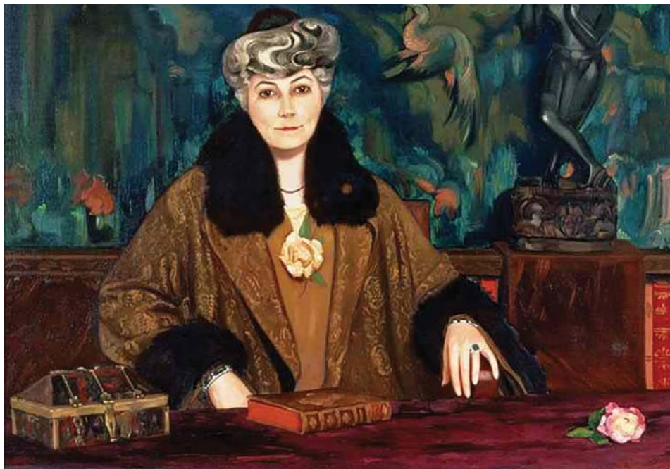
Helena Roerich por Svetoslav Roerich

R. Você vê, se uma pessoa vive falsamente, ele deve corrigir a própria vida. Um homem que vive uma vida falsa não