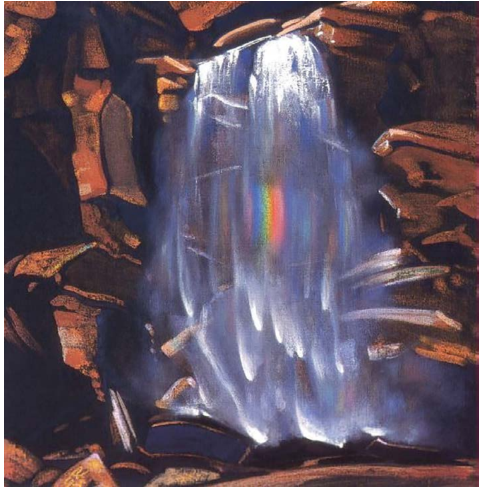
Rainbowfall por Svetoslav Roerich, 1934