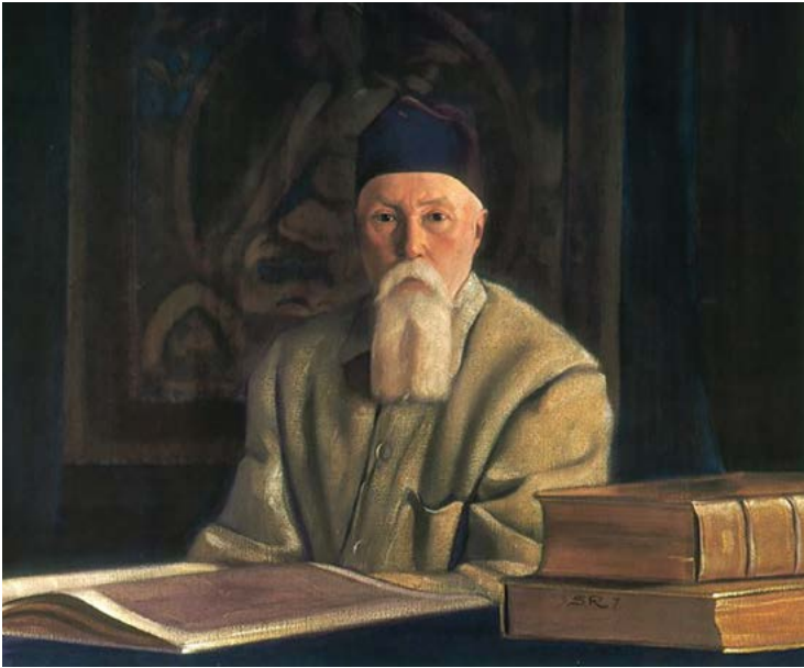
Nicholas Roerich por Svetoslav Roerich, 1937

De onde são originadas todas as iluminações espirituais e as acumulações espirituais?