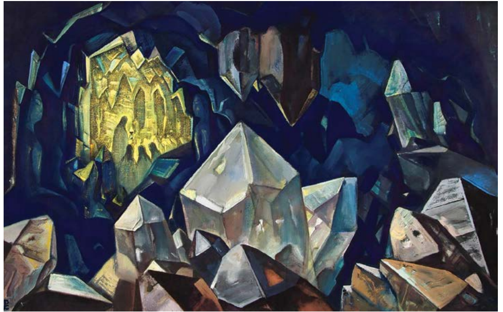
Most Sacred Treasure of the Mountain , Nicholas Roerich, 1933

“H. P. Blavatsky che portò un “oceano di saggezza” - le grandi dottrine della filosofia orientale alle menti occidentali, fu braccata, diffamata, calunniata, non solo dagli stranieri e dai nemici, ma anche da quelli a lei molto vicini. E anche