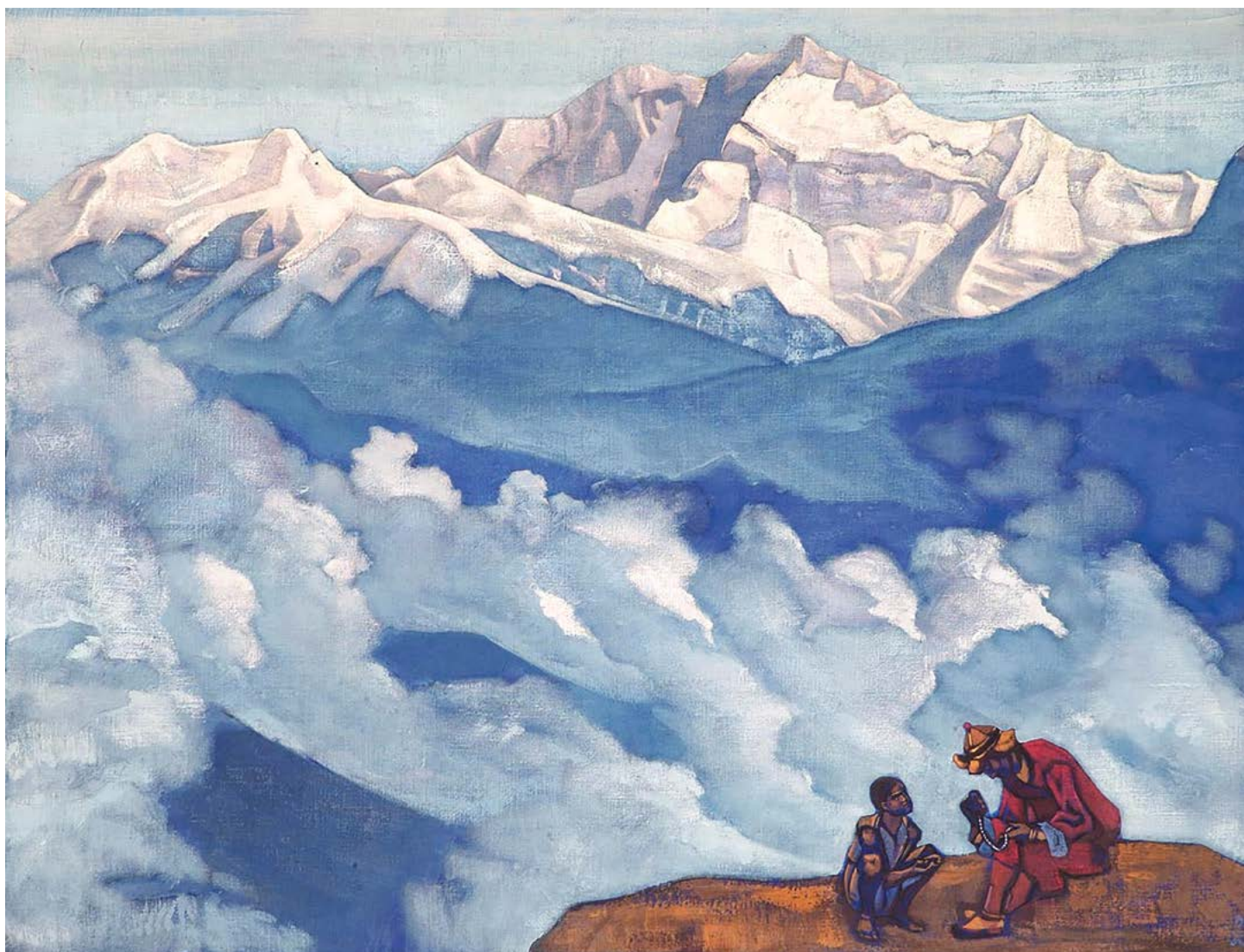
Pearl of Searching , Nicholas Roerich, 1924

loro, il Prof. Roerich fondò una scuola di arti, chiamata Master School of United Arts. Successivamente vennero fondati il Museo di Roerich, la Società Agni Yoga, il Centro Internazionale d'Arte, e più tardi il Comitato per il Patto Roerich e Banner of Peace (Bandiera della Pace). Questo fu il fondamento culturale profondo e di maggior gradimento posto nell'anima dell'America. Questa fu una delle imprese della loro grande Missione.